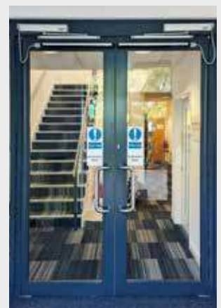
NEXT 75 + NEXT-BDT