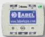
Programmatore digitale Digital selector