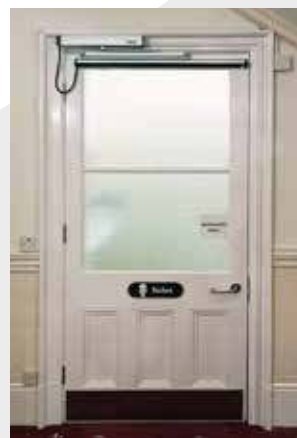
NEXT 150 + NEXT-BDT