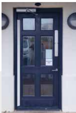
NEXT 75 + NEXT-BAS